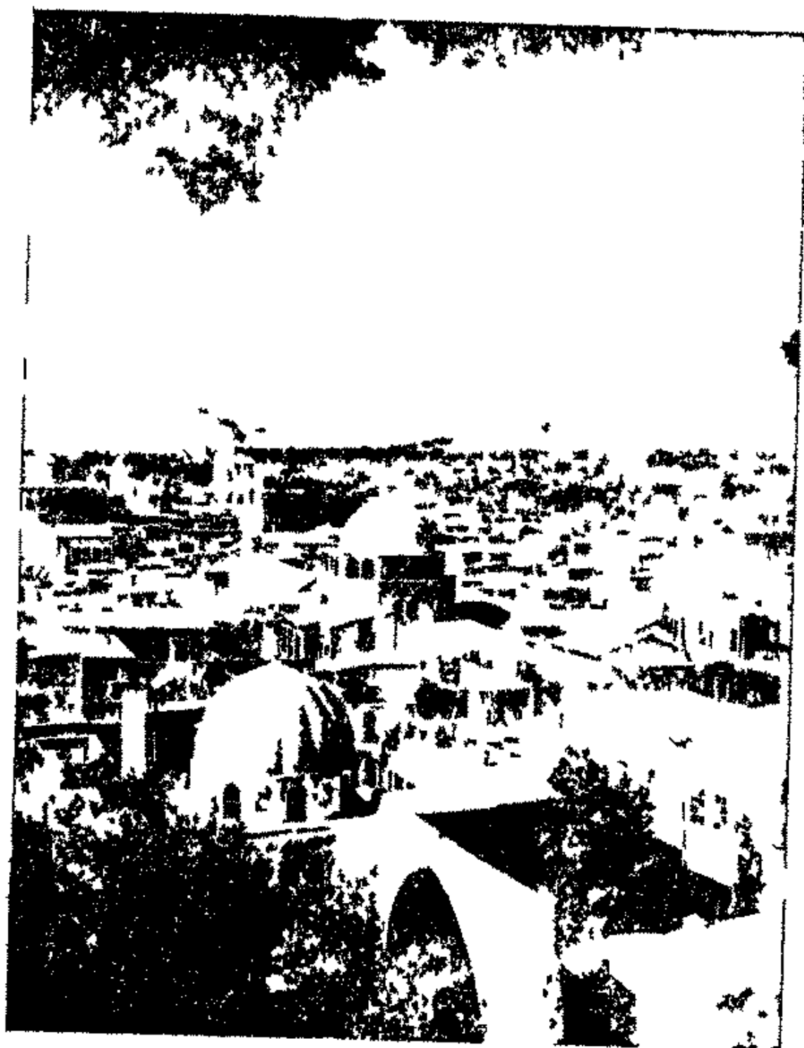
م طر نام لده سق